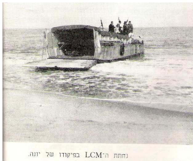
יהודה בן-צור קיסריה, מאי 2006

"היות 'הנמ"כים' במצב טכני מעולה וצוותותיהם מאומנים, איפשר בצוע מהיר..."