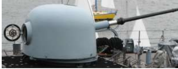
פאיור 1 תותח אוטומלרה 76.2